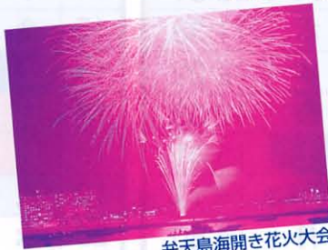
弁天島海開き花火大会