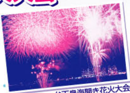
弁天島海開き花火大会