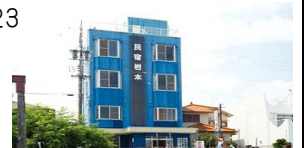
団体 37 名様まで宿泊できます

新鮮な浜名湖の魚介を中心 とした、海の幸の盛り合わせ で皆様をお待ちしています。