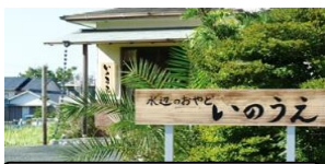
団体 20 名様まで宿泊できます