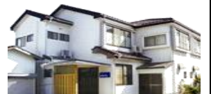
団体 20 名様まで宿泊できます