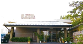
30 名様以上貸切できます