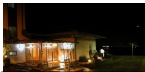
団体 20 名様まで宿泊できます